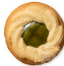
俄罗斯蛋糕<花形奇异果>

原材料名：小麦粉（日本国内制造）、人造奶油、砂糖、奇异果果酱、鸡蛋、杏仁粉、加糖炼乳、食盐 / 山梨醇、膨胀剂、增稠剂（果胶）、pH调节剂、着色剂（栀子、红花黄、红曲、胡萝卜素）、香料（含有：小麦、鸡蛋、乳制品、杏仁、奇异果、大豆）