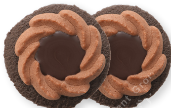
俄罗斯蛋糕<浓苦巧克力>

原材料名：小麦粉（日本国内制造）、人造奶油、砂糖、准巧克力（植物油脂、可可粉、砂糖、可可块、全脂奶粉）、鸡蛋、可可粉、杏仁粉、加糖炼乳、食盐 / 膨胀剂、乳化剂、香料、着色剂（胡萝卜素）（含有：小麦、鸡蛋、乳制品、杏仁、大豆）