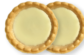
迷你法式干点<白巧克力>

原材料名：小麦粉（日本国内制造）、巧克力涂层（植物油脂、砂糖、全脂奶粉、乳糖、可可脂）、人造奶油、砂糖、鸡蛋、杏仁酱（杏仁、砂糖、水飴）、杏仁、起酥油、洋酒、果葡糖浆、食盐 / 乳化剂、香料、膨胀剂、着色剂（胡萝卜素）（含有：小麦、鸡蛋、乳制品、杏仁、大豆）