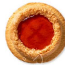
俄罗斯蛋糕<草莓马卡龙>

原材料名：小麦粉（日本国内制造）、草莓果酱、砂糖、人造奶油、花生、鸡蛋、蛋白、椰丝、杏仁粉、加糖炼乳、食盐 / 山梨醇、增稠剂（果胶）、pH调节剂、膨胀剂、着色剂（红曲、胡萝卜素）、香料（含有：小麦、鸡蛋、乳制品、花生、杏仁、大豆）