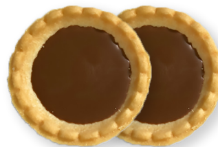
迷你法式干点<牛奶巧克力>

原材料名：小麦粉（日本国内制造）、准巧克力（植物油脂、砂糖、可可块、全脂奶粉、可可脂）、人造奶油、砂糖、鸡蛋、杏仁酱（杏仁、砂糖、水飴）、杏仁、起酥油、洋酒、果葡糖浆、食盐 / 乳化剂、香料、膨胀剂、着色剂（胡萝卜素）（含有：小麦、鸡蛋、乳制品、杏仁、大豆）