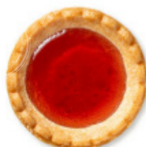
迷你法式干点<草莓>

原材料名：草莓果酱（日本国内制造）、小麦粉、人造奶油、砂糖、鸡蛋、杏仁酱（杏仁、砂糖、水飴）、起酥油、洋酒、果葡糖浆、食盐 / 山梨醇、增稠剂（果胶）、pH调节剂、着色剂（红曲、胡萝卜素）、香料、膨胀剂（含有：小麦、鸡蛋、乳制品、杏仁、大豆）