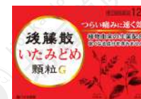
○ 后藤感冒药颗粒 后藤止咳药 后藤止疼药